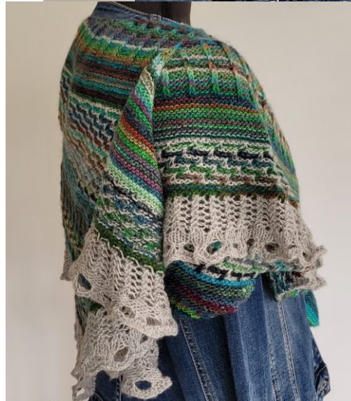
Farbiges Garn: 100% Wolle, Uni-Garn: 72 % Baumwolle, 17% Wolle, 11% Alpaka: Fr. 95.–