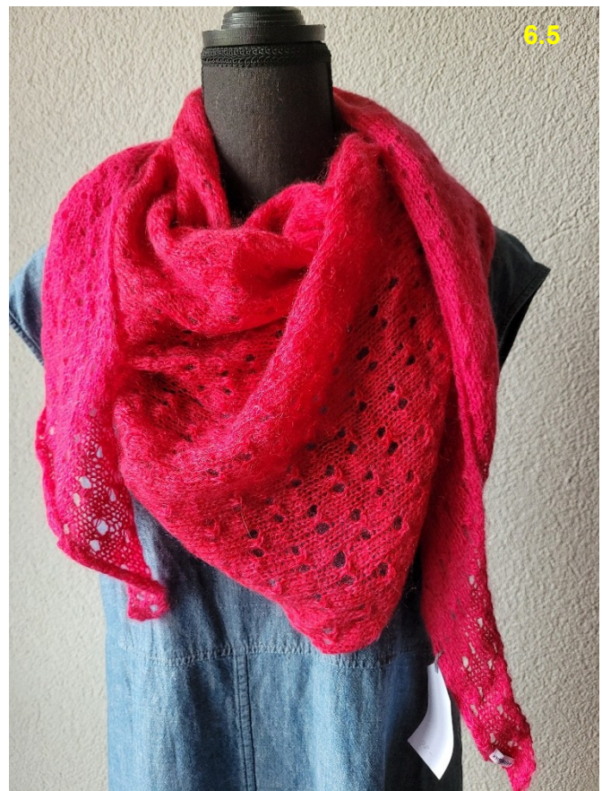
50% Wolle, 30% Mohair, 20% Seide: Fr. 78.–