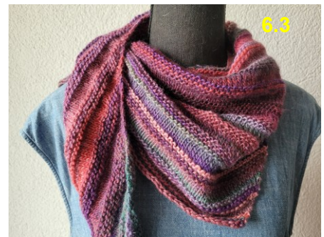
Mini-Dreiecktuch, 100% Schurwolle, in verschiedenen Farben erhältlich: Fr. 30. Gerne präsentiere ich Ihnen bei Interesse meine aktuelle Auswahl.