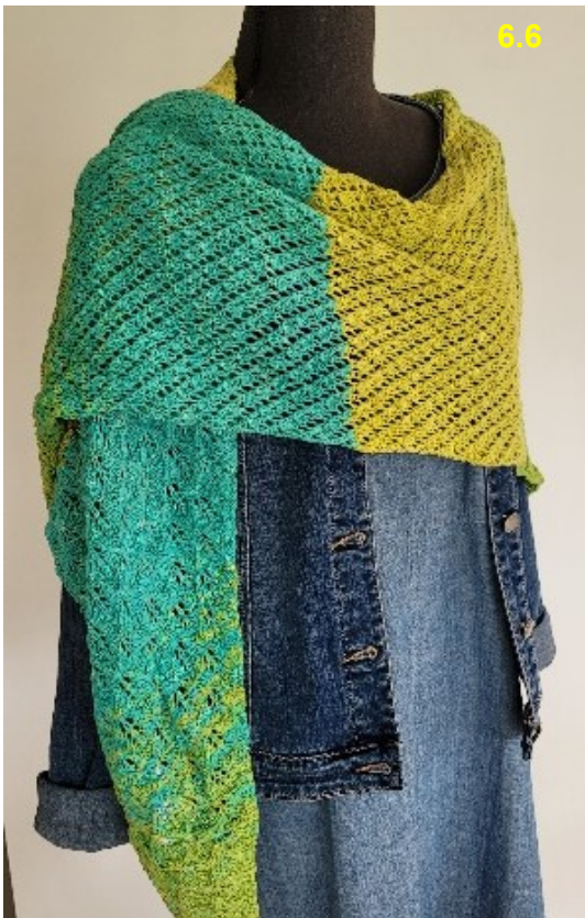
70% Baumwolle, 18% Viskose, 12% Leinen Fr. 95.–