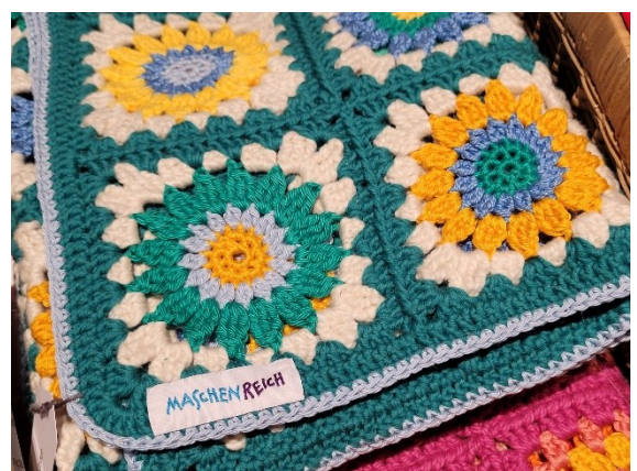
100% Baumwolle, ca. 85x60 cm: Fr. 75.–