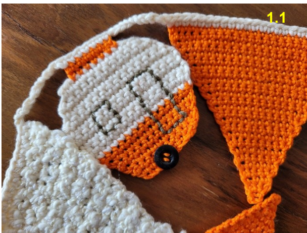
Girlande, ca. 120 cm: Fr. 25.–