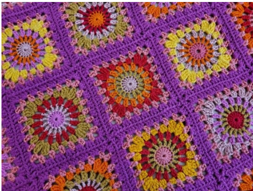
100% Baumwolle, ca. 80x60 cm: Fr. 75.–