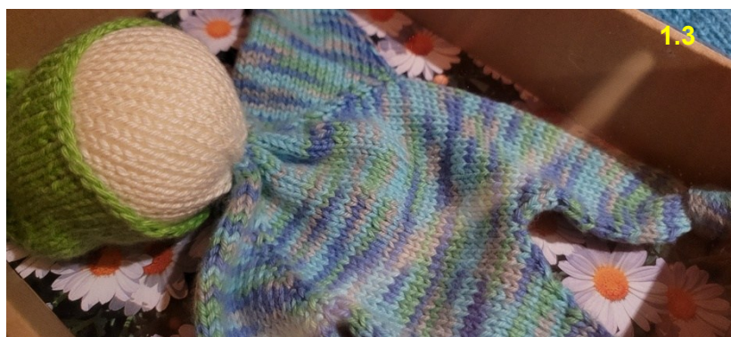
Knuddelchen, 100% Baumwolle: Fr 25.–