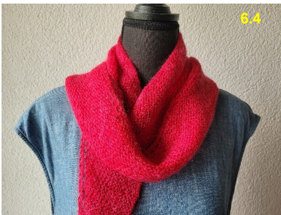
50% Wolle, 30% Mohair, 20% Seide: Fr. 30.–