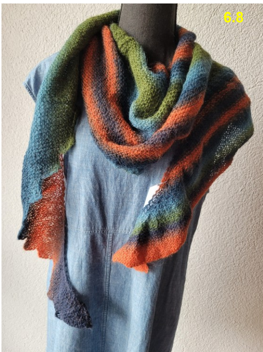
Wolle/Mohair-Gemisch: Fr. 49.–