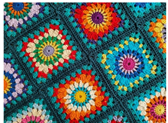
100% Baumwolle, ca. 120x80 cm: Fr. 95.–